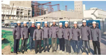
天津市东丽区生活垃圾综合处理厂项目监理部