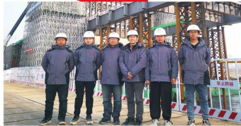
临沂市武汉路汾河桥工程项目监理部

（2）扬尘治理工作常抓不懈，要从讲政治的高度上看待扬尘治理工作。2020年公司在扬尘治理方面失分最多，直接影响了公司的信用评价。各位总监要高度重视这个问题，平时一定要多说、多写、多记录，收集好在扬尘治理工作方面的监理记录，做到“到岗履职”。