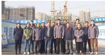
济南北湖项目二标段监理工程项目监理部