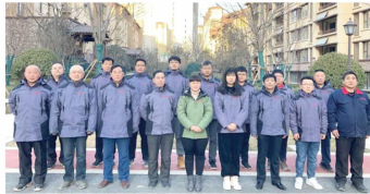
济南兴隆片区新地块住宅项目监理部