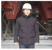
中节能(临沂)环保能源有限公司二标段燃机电项目总监王